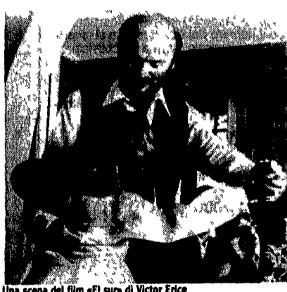
Una scena del film «Il surfo di Victor Erice»

La Makumba. Via degli Olimpionici 19, tel. 3964392 Afro-latina. Amnesty club. Via Palermo 34, tel. 4757828 Anche piano bar L'Alibi. Via di Monte Testaccio 44 Gay disco. L'Angelo Azzurro. Via cardinal Merry Del Val 13, tel. 5800472 Disco e funky. Free Time. Via Filomatino 10, tel. 8449254 Da giovedì a domenica afro. L'Incontro. Via della Penna 25, tel. 3610934 Anche piano bar New Life. Via XX Settembre 8 tel. 4740997 Rap e disco. Valentino notte. San Felice Circeo, lungomare Circe. Anche ristorante. Perla del Tirreno. Santa Marinella via Aurelia km. 61 800, tel. 0766/737345 Esibizioni dal vivo feste a tema. Miraggio club. Fregene Lungomare di Ponente 93 Concerto e serate a tema.