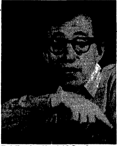
Woody Allen sarà uno dei campioni di «Cinema 5»