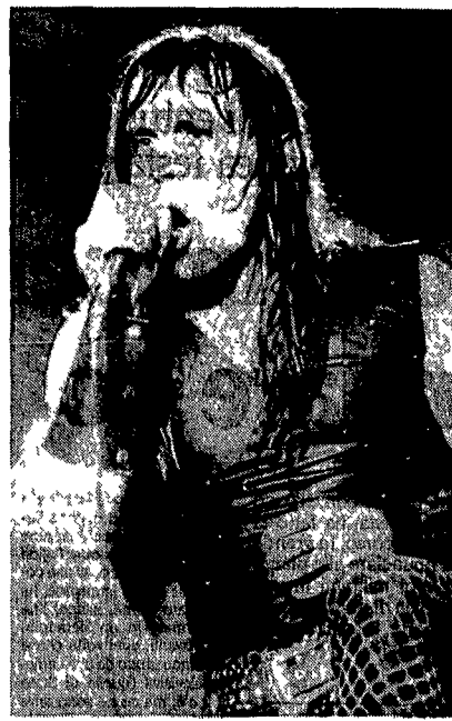
Uno dei protagonisti di «Monsters of rock»