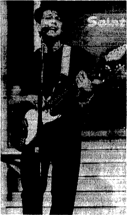
Sergio Caputo in concerto stasera a Euritma