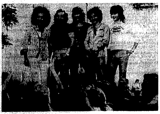
Il complesso dei Camaleonti stasera in concerto alla Festa dell'Unità di Villa Gordiani