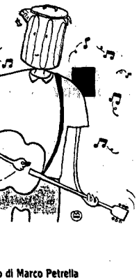
Disegno di Marco Petrella

Resta da dire dell'accoglienza ricevuta dai gruppi ospiti, calorosissima per i francesi City Kids, gli svedesi Creeps ed i tedeschi Die Toten Hosen, ma l'elemento più curioso erano senz'altro le formazioni provenienti dall'Est, i punk ungheresi Galloping Corona, i cecoslovacchi Stroboli e specialmente gli jugoslavi Demolition Group, che avrebbero meritato ben più consistente successo di pubblico per la loro musica dance elettrica e passionale. E non è solo colpa della contemporanea con la diretta tv del concerto di Prince; forse ci sono ancora molte barriere culturali da infrangere.