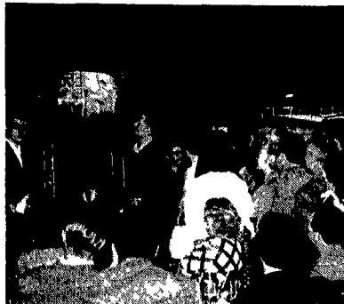
Giugno 1981. I democristiani di tutta Italia seguono col fiato sospeso le trattative segrete tra i vertici dc e la camorra