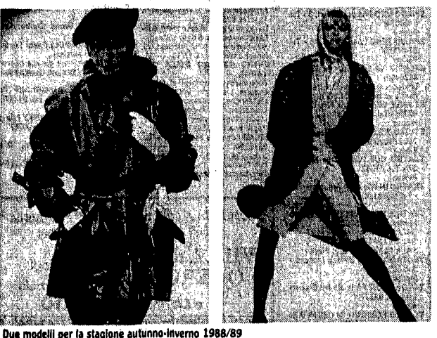
Due modelli per la stagione autunno-inverno 1988/89