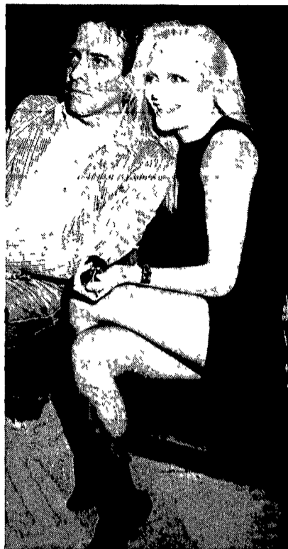
Qui sopra e a sinistra Enrico Montesano e Anna Oxa, i protagonisti e presentatori della prossima edizione di «Fantastico»

ROMA Dimenticare Celentano. Di menarlo anche a costo di cedere qualche punto percentuale di ascolto a Berlusconi. È stato questo il vleit motivo della conferenza stampa di presentazione di Fantastico 9. Un esempio per tutti. L'accortezza con la quale Montesano ha garantito che i problemi dell'attualità non scompariranno, ma che saranno affrontati con il tono e il linguaggio che si contano a una varietà.