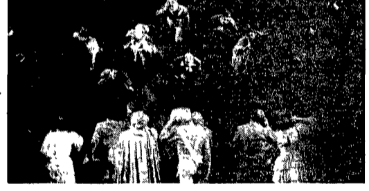
Una scena de «I due sergenti» di Attilio Corsini

ANTONELLA MARRONE Eravamo nel dicembre del 1986. Nasceva a Testaccio, in piazza S. Maria Liberatrice, il Teatro Vittoria sulle ceneri del vecchio cinema omonimo. Oggi, in questa, dunque, la sua terza stagione. Sorta con l'intenzione di regalare a Roma qualche sorriso teatrale, la sala, diretta dalla Compagnia Attori & Tecnici, ha ospitato compagnie internazionali, spettacoli inconsueti. Tutto all'insegna di un teatro comico. Per quest'anno è previsto un cartellone internazionale, con alcuni ritorni e nuove produzioni nazionali. In apertura la rassegna di Teatro Africano che fino al 29 settembre proporrà testi di autori del Malawi, dell'Angola, del Madagascar, del Congo e della Tunisia. Dal 30 settembre al 5 ottobre i clowns di Footsbarn (Inghilterra) presenteranno il loro più vecchio spettacolo, Circus Tosov. Ancora internazionale con la Biennale lo l'attore che dal 6 ottobre fino al 19, in collaborazione con il Centre Drama-