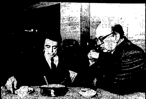
Un caffè per tenere buona l'opposizione...