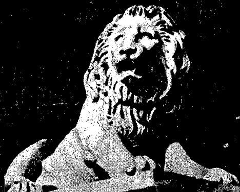
È svegliato dal frastuono.