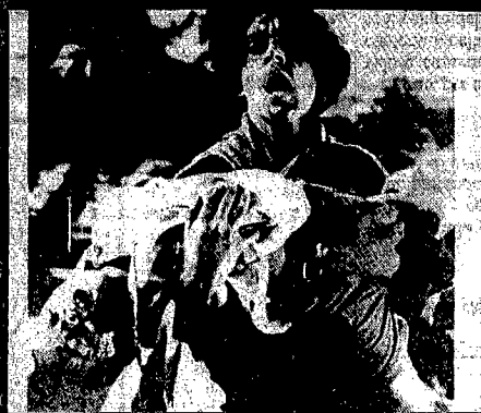
Era nuovo, era nuovo!

Nella confusione nascono tragici fraintesi.