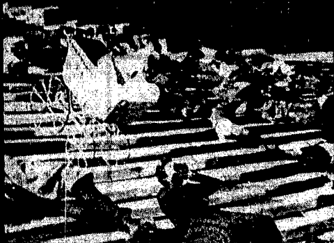
Le stive vengono svuotate sulla gradinata del Duomo.