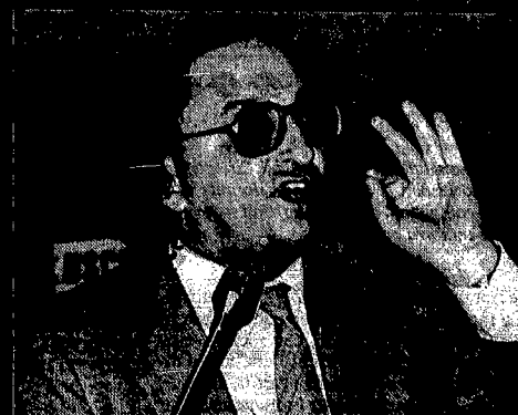
È deciso, i rifiuti ce li teniamo.