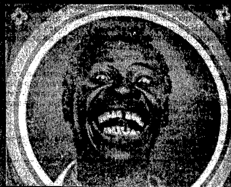
I nigeriani tirano un sospiro di sollievo. Basta monnezza, sporchi bianchi!