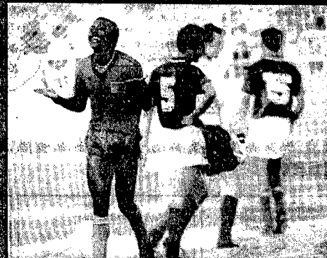
Anche loro ridono, ma per altri motivi.