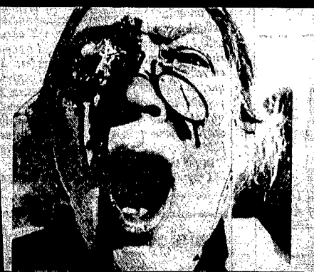
Noooo! Il detersivo senza i fosfati lava meno bianco!

Nella confusione nascono tragici fraintesi.