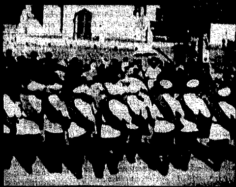
Il governo interviene