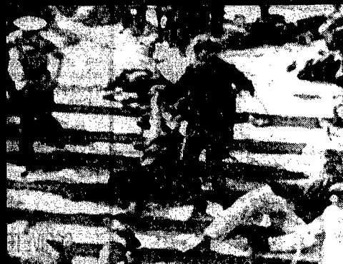
La popolazione inciampa sulle pile riciclate...