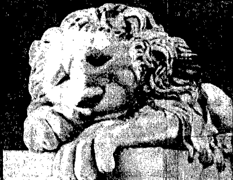
Il Presidente della Repubblica