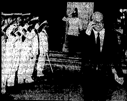
...e una rapida rassegna delle speciali squadre di pulizia.