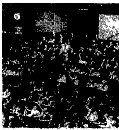
Un momento dell'assemblea di Montecitorio.