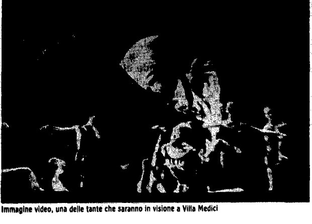
Immagine video, una delle tante che saranno in visione a Villa Medici