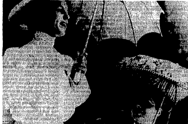
Una scena dal film «Picnic at Hanging Rock» di Peter Weir