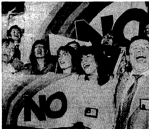
La gente scende in piazza e fa festa dopo l'annuncio della vittoria del «no»

Il Cile esulta e già comincia il «dopo Pinochet». Il governo è dimissionario e ora si attendono le mosse del dittatore. Pinochet potrebbe respingere le dimissioni o accettarle solo in parte. L'opposizione, felice, afferma: «Non volevamo noi il plebiscito, noi volevamo elezioni libere. Chiediamo alle forze armate di avviare insieme la transizione verso una autentica democrazia».