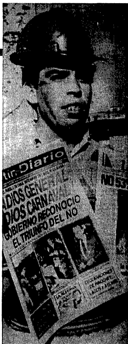
«Adios general»: un operaio mostra trionfante la prima pagina di un quotidiano che annuncia a tutta pagina l'esito del referendum