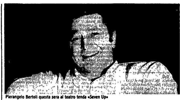
Pierangelo Bertoli questa sera al teatro tenda «Seven Up»

Galleria nazionale d'arte moderna. Gastone Novelli 1925-1968; Achille Perilli, Opere 1947-1988; Luigi Cosenza, l'Ampliamento della Cnam e altre architetture.