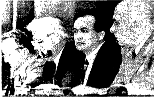
Il presidente della Lega Suvar e Sucnic, ministro della Difesa, ascoltano il discorso del segretario Korosec