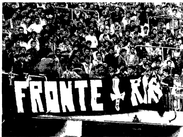
Uno degli strascioni tolti dalla polizia ad Ascoli.