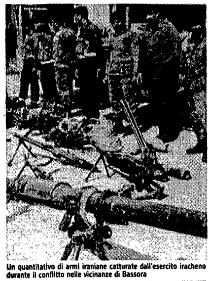
Un quantitativo di armi iraniane catturate dall'esercito iracheno durante il conflitto nelle vicinanze di Bassora

Tangente-story Italia-Irak: prende corpo all'inizio degli anni Settanta sotto forma di un'appetosa commessa di undici navi da guerra. Per l'Italia scendono «in guerra» due aziende: una del gruppo Iri e una del gruppo Efim. Inizia una storia di dollari e di mediatori prezzolati che porterà davanti all'Inquirente due ex ministri della Repubblica: Nicola Capria ed Enrico Manca.