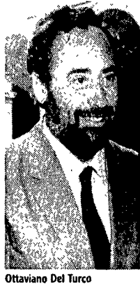
Ottaviano Del Turco