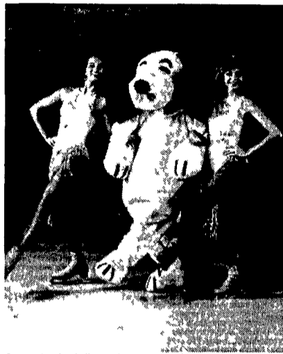
Snoopy tra due ballerine di «Holiday on ice»