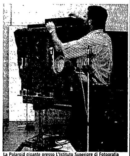
La Polaroid gigante presso l'Istituto Superiore di Fotografia

di taselli del grande affresco ripresi al naturale, la seconda è stata riprodotta in presa diretta, in quattro pezzi da tre metri per uno, costruendo ad hoc una gigantesca fotocamera all'interno dei Musei Vaticani. Visitando i set dell'Istituto superiore di fotografia (e lo possono fare tutti i curiosi o gli appassionati fino a domani, dalle 10 alle 20.30) si possono seguire tutte le fasi della realizzazione di un'immagine: dall'allestimento della «situazione» alla fotografia finita. Le immagini realizzate nei quattro giorni di lavoro verranno poi esposte presso la sede dell'Istituto da domani al 3 dicembre, in una mostra dal titolo «Big is beautiful». Un «grande» bello, ma anche molto impegnativo: per la prima volta gli allievi si sono cimentati nella sperimentazione di progetti e immagini creative che esaltino le caratteristiche della macchina, il grandissimo formato e lo sviluppo immediato.