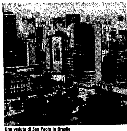
Una veduta di San Paolo in Brasile

Il governo Sarney è stato battuto, in Brasile vince la sinistra. È questa l'indicazione netta che emerge dai primi risultati delle elezioni municipali. Tra le formazioni dell'opposizione si profila una clamorosa avanzata del Pt, il partito dei lavoratori. Tanto che una sua rappresentante, Luiza Erundina de Souza, sarà quasi certamente il nuovo sindaco di San Paolo.