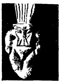
Una maschera veneta