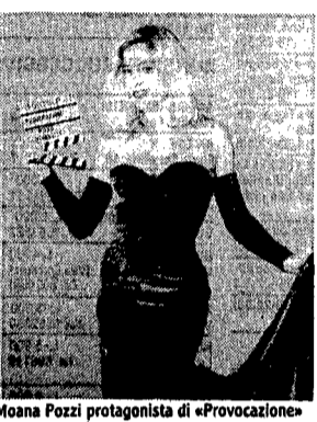
Moana Pozzi protagonista di «Provocazione»

La sporca guerra o una sfilata di moda con maniaco?