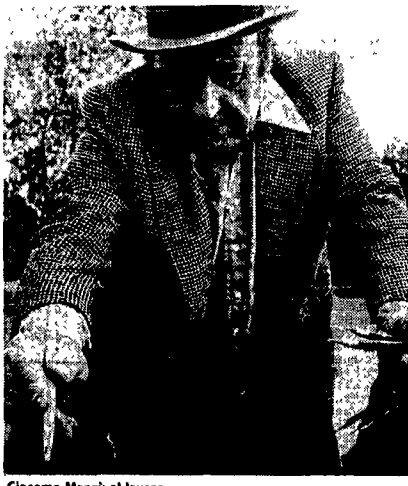
Giacomo Manzù al lavoro

Anno primo, numero zero: l'altra sera a Palazzo Valentini si è celebrato il battesimo di «Avvenimenti», l'ultimo nato dell'editoria. La rivista, a cadenza settimanale, si palesa fin dall'immagine di copertina (un drago in bombetta chiamato «banca» che inghiotte avidamente i suoi poveri concorrenti), provocatoria e senza pietà con tutti i nemici della giustizia e del «vero» giornalismo: le banalità, i compromessi, gli scopi da cassetta, la volgarità, le sponsorizzazioni e via discorrendo.