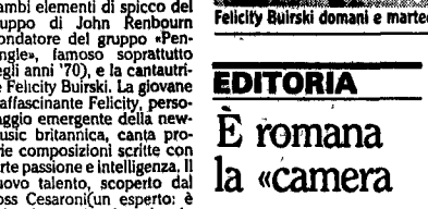
Felicity Buirski domani e martedì al Folkstudio