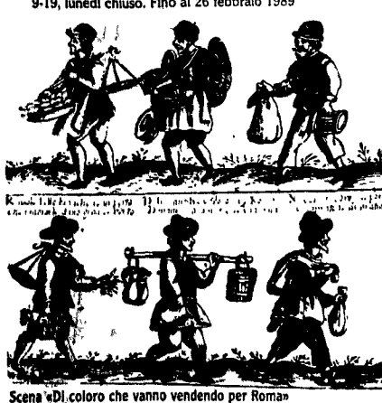
Scena di coloro che vanno vendendo per Roma

Museo dell'energia elettrica. Dall'astrolabio di Galileo all'informatica: prima rassegna completa in Europa. Piazza Elio Rufino; ore 9-13 e 16-20, tutti i giorni, compresi i festivi, ingresso libero. Fino al 30 dicembre. Villa Pamphili. Il parco e gli edifici: mostra stonco-fotografica, palazzina Corsini (ingresso da Porta S. Pancrazio), ore 10-13 e 15-18, lunedì chiuso. Fino al 30 dicembre. Giovedì artisti a Roma. Ex Borsa Campo Boario, via di Monte Testaccio; ore 9.30-13.30, giovedì e sabato anche 16-19. Fino all'11 dicembre. Alunmere. Centro documentazione tradizioni popolari, Palazzo camerale: sezioni espositive sull'ottava rima, sulla cultura contadina e operaia; martedì e giovedì ore 17-19, domenica 10-13. Vetri del Cesari. Capolavori di Roma imperiale, Musei capitolini, piazza del Campidoglio, ore 9-13.30 e 17-19.30, festivi 9-13, lunedì chiuso. Fino al 31 gennaio. Villa Medici. Restauro: arazzi Gobelin, sculture, dipinti, frotta di stoffe delle collezioni dell'Accademia di Francia, viale Trinità dei Monti 1, ore 10-13 e 16-19, lunedì chiuso. Fino all'8 dicembre. Giulio Pionati. Galleria nazionale d'arte moderna, Valle Giulia. Itinerario visivo-mentale in 7 sezioni che ricostruisce con opere e installazioni la ricchissima e originale esperienza concettuale dell'artista; ore 9-14, domenica 9-13, sabato 9-19, lunedì chiuso. Fino al 26 febbraio 1989.