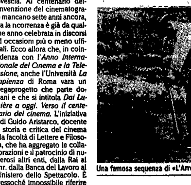
Una famosa sequenza di «L'Arroseur arrosé» (1895) di Louis Lumière

È una sorta di conto alla rovescia. Al centenario dell'invenzione del cinematografo mancano sette anni ancora, ma la ricorrenza è già da qualche anno celebrata in discorsi ed occasioni più o meno ufficiali. Ecco allora che, in coincidenza con l'Anno Internazionale del Cinema e la Televisione, anche l'Università La Sapienza di Roma vara un megaprogetto che parte domani e che si intitola Dal Lumière a oggi. Verso il centenario del cinema. L'iniziativa è di Guido Aristarco, docente di storia e critica del cinema alla facoltà di Lettere e Filosofia, che ha aggregato le collaborazioni e il patrocinio di numerosi altri enti, dalla Rai al Cnr, dalla Banca del Lavoro al ministero dello Spettacolo. È pressoché impossibile riferire l'intero programma della manifestazione che si concluderà soltanto l'8 di dicembre e si rivolge ad un pubblico eterogeneo, di appassionati, studenti e studiosi, con due appuntamenti quotidiani, alle 9.30 e alle 15.30, entrambi nella spaziosa Aula Magna. Relazioni e testimonianze più