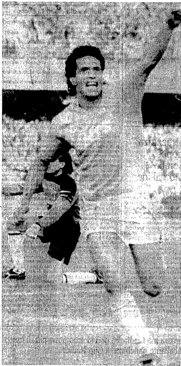
Careca esulta: con la doppietta segnata al Milan è ora capocannoniere del torneo con 7 reti