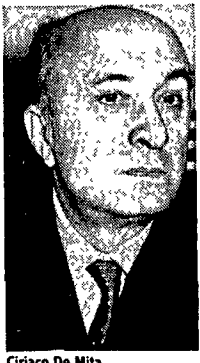
Ciriaco De Mita

Rifugge dalle polemiche Mino Martinazzoli, che pure vive con sofferenza il travaglio della sinistra dc. Ma non vuole che ci siano ambiguità sul ruolo della corrente che si richiama a Moro: «È un ruolo di cambiamento da giocare prima e dopo il congresso...»