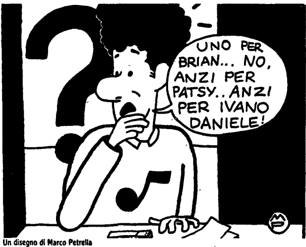
Un disegno di Marco Petrella

■ Pino Daniele (Domani e martedì al Tenda Pianeta). Il «guglione» è cresciuto e «Schizichia with love» lo conferma artista dotato di grande temperamento e notevole capacità. Il cocktail anglo-napoletano (vera e propria passione