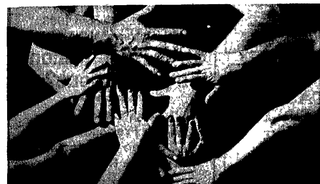
La foto di copertina del primo numero di «Monograph»