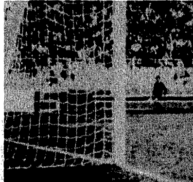
DAL NOSTRO INVIATO GIANNI PIVA

I genovesi sprecano molte occasioni e i romani li puniscono con i gol di Voeller e Massaro