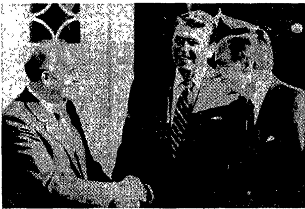
Mikhail Gorbaciov stringe la mano a George Bush sotto lo sguardo sorridente di Ronald Reagan

Impressione sul «ideologo» Reagan che sul «pragmatico» Bush. Con una dichiarazione un po' meno da statista mondiale e un po' più da ragioniere, il presidente eletto a succedere a Reagan aveva dichiarato al rientro a Washington da New York: «Benissimo le riduzioni, ma non risolvono in alcun modo il problema degli squilibri militari in Europa». E Shultz, in una conferenza stampa, pur riconoscendo che «le riduzioni, essendo unilaterali, sono benvenute e rappresentano un passo significativo nella giusta direzione», aveva aggiunto che, a giudizio della parte americana, «anche dopo che siano complete, nel 1991, manterrebbero una significativa asimmetria (a favore del Patto di Varsavia). Quindi c'è molto da negoziare».