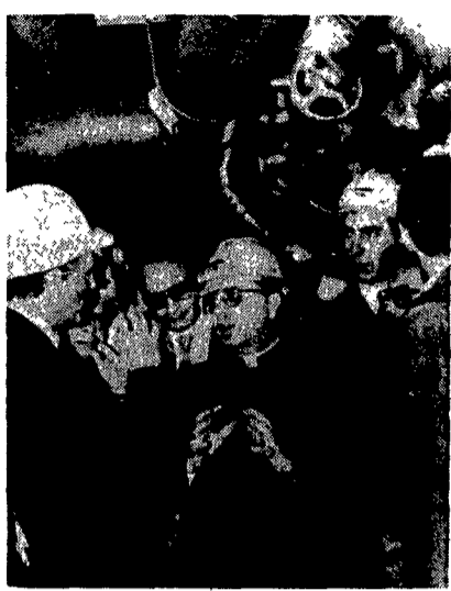
L'arcivescovo di Napoli, Michele Giordano, durante una visita all'altare di Bagnoli

grande palazzo che si affaccia su piazza Pitagora. L'altra parte del quarto piano ed il terzo sono abitati dai proprietari dell'emittente, padroni anche di un grande emporio di abbigliamento che occupa i primi due piani della costruzione.