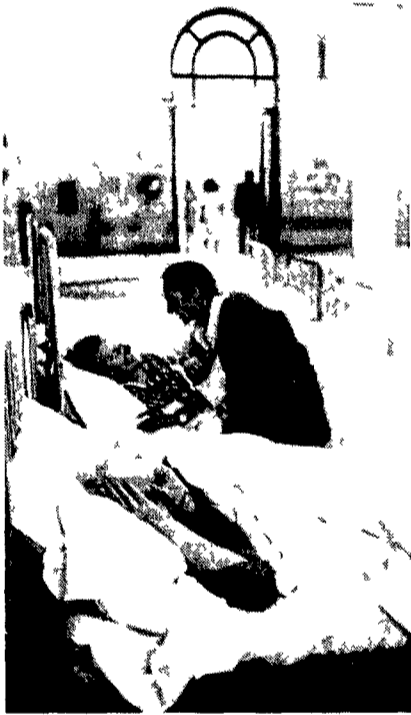
Anziani ricoverati al Policlinico