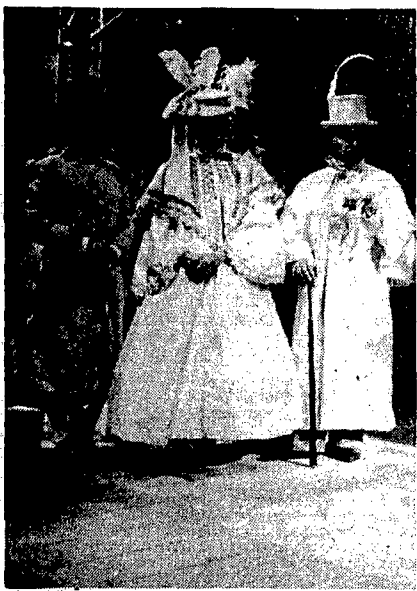
Un momento di «Inesprimibile silenzio» da Jean Tardieu