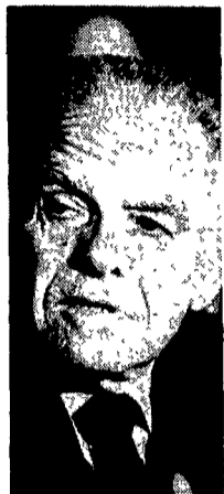
Il primo ministro Shamir

Colpo di scena in Israele: Shamir risponde alla svolta americana verso l'Olp rilanciando la costituzione di un governo di destra, senza i laburisti.