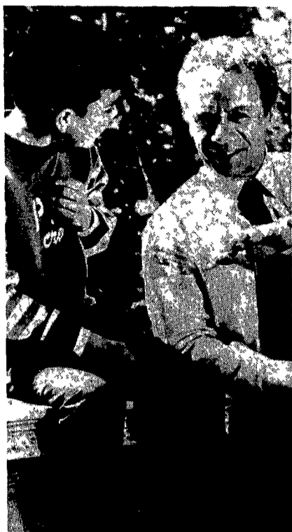
Johnny Dorelli in una scena di «Un milione di miliardi»

Nonsolonerò, la rubrica del Tg2 in onda alle 14,45, avrà una piccola stragna natalizia per gli immigrati italiani: metterà a disposizione un «numero verde», ossia un numero telefonico chiamando il quale da qualsiasi località in Italia senza prefisso e con la spesa di un solo gettone ogni straniero nel nostro paese potrà chiedere un aiuto per rintracciare parenti o amici dei quali si siano perse le tracce o che risultino, comunque, difficilmente raggiungibili. Il servizio si chiamerà, appunto «Nonsolonerò» e rimarrà attivo dal 27 dicembre al 28 febbraio 1989. Il numero telefonico è 1678 60025. La puntata di Nonsolonerò sarà inoltre dedicata a tutte le religioni che l'immigrazione straniera ha portato nel nostro paese e in particolare, all'Islam, religione della maggioranza degli immigrati.