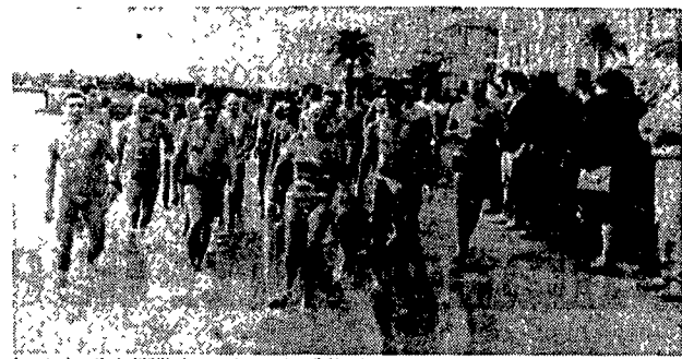
I partecipanti al «XXVII cimento invernale» di Alassio

hanno consegnato fondi per i terremotati sovietici al cardinal Martini, in visita presso di loro.