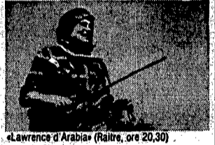
«Lawrence of Arabia» (Raitre, ore 20,30)