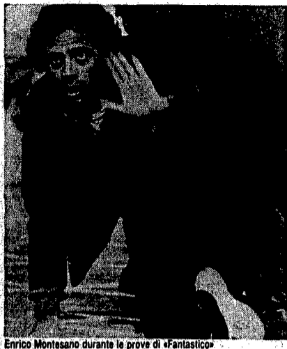
Enrico Montesano durante le prove di «Fantastico»

Auguri a Manfredi, che dopo aver sfornato con Colletti bianchi la serie forse più dignitosa tra quelle prodotte da Berlusconi, ha subito l'effetto Auditel: la logica dei numeri, che non necessariamente è quella della qualità. Anzi. Il rischio è proprio quello che, per evitare i pericoli del mare mosso, non si vede il pericolo più grosso, che è quello di un appiattimento della tv verso il basso, una aurea mediocritas elettronica che va bene solo per la diffusione dei messaggi pubblicitari. E forse neanche.