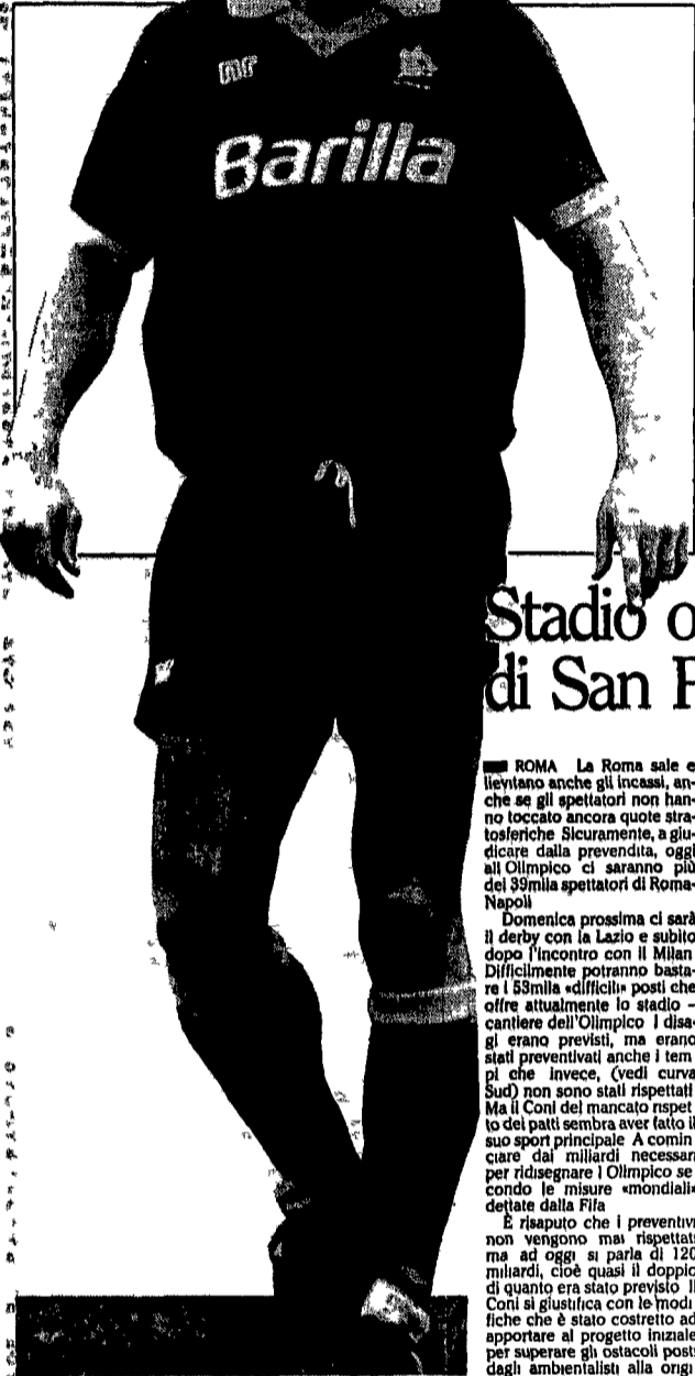
Rudi Voeller è nato il 13/4/60 ad Hanau (Rft). Ha esordito in serie A il 13 settembre '87