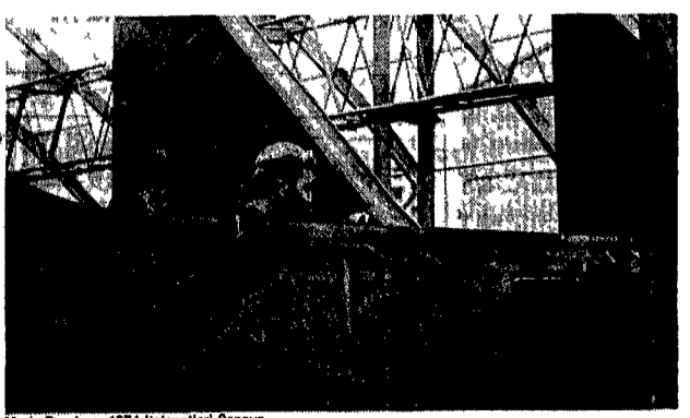
Mario Dondero, 1974 Italcantieri Genova

Si è avviata l'altra sera (Aula Magna della Sapienza) un ciclo di «maratone» per un «tutto Chopin», messo insieme, ci sembra, un po' alla rinfusa.