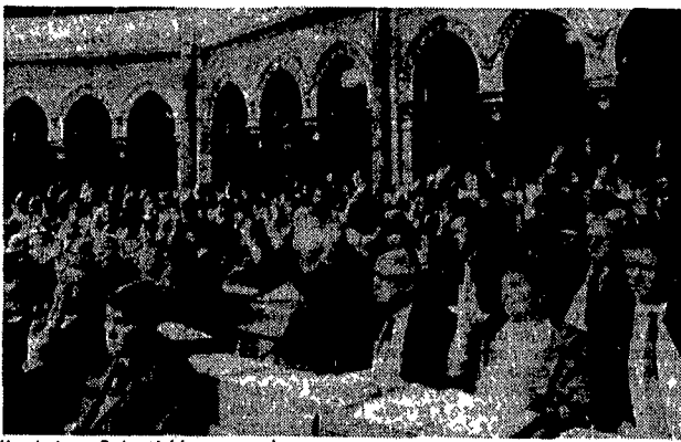
Una riunione a Budapest del governo ungherese

I movimenti alternativi ungheresi giudicano la legge sul diritto di riunione e di associazione approvata dal Parlamento un passo importante verso lo stato di diritto.