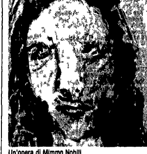
Un'opera di Mimmo Nobile

Orologio . La Compagnia dell'Atto presenta da lunedì fino al 5 febbraio presso la Sala Cafiteatro Miseria Bella . Tre atti unici di Peppino De Filippo regia di Olga Garavelli. La scelta della compagnia è «caduta» su Peppino, perché «i presenta a noi come l'ideale continuatore della più antica arte teatrale italiana: dalla marionette alla Commedia dell'arte e, come sempre ci dimo stra che le più sincere risate nascono dalle piccole grandi tragedie del vivere quotidiano».