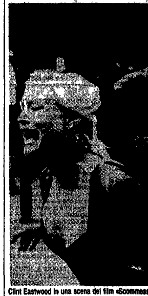
Clint Eastwood in una scena del film «Scommessa con la morte»

Cercando un'altra America Monti Appalachi in musica