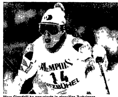
Marc Girardelli ha scavalcato in classifica Zurbriggen