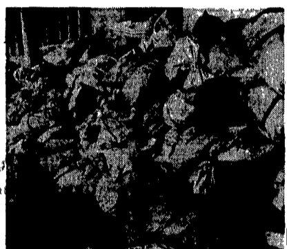
Spariamo in futuro di non vedermi più