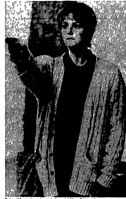
Debra Winger in un'inquadratura del film «Betrayed»

poi quando bisogna suggerire la denuncia con una scelta rigorosa univoca si preferisce divagare, moraleggiare soltanto con generico e innocuo approccio. Guardiamo, appunto in dettaglio a ciò che accade in Betrayed-Tradita . Il titolo è ampiamente giustificato. In una dimensione sociologica stravolta, allucinata, rinvenibile a mezza via tra la convulsa Chicago e le desolate campagne in crisi del Midwest un gruppo di fanatici, violenti estremisti di destra - contadini esasperati, reduci dal Vietnam, frustrati e balordi di ogni specie - spara, ammazzando chiunque costituisca per loro un pericolo, una minaccia. Cioè, negri, ebrei, comunisti, ecc. In simile mitico, gli agenti federali vogliono fare chiarezza e, se possibile, scongiurare nuovi misfatti. Allo scopo, una giovane, avvenente poliziotta s'infila nel gruppo degli scatenati razzisti. Però, quasi subito, s'innamora proprio del più risoluto e intollerante tra costoro, un vedovo con due figli a carico dall'aria formal-