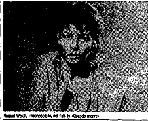
Raquel Welch, iriconoscibile, nel film tv «Quando morire»