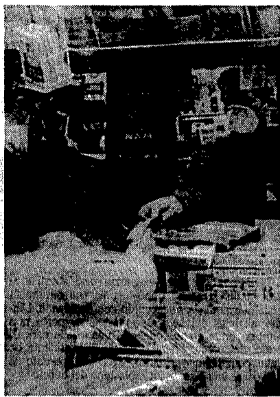
Un edicolante milanese, vende giornali e si protegge con la mascherina.