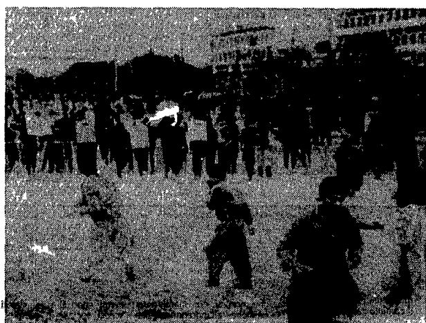
Folla sassaiola tra dimostranti e polizia ad Islamabad dinanzi al Centro Informazioni Usa