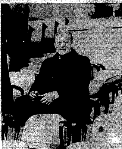
La poltroncina è certo più comoda della panchina, ma il Barone sicuramente baratterebbe il suo mesto sorriso con la faccia cupa del suo erede Spinosi