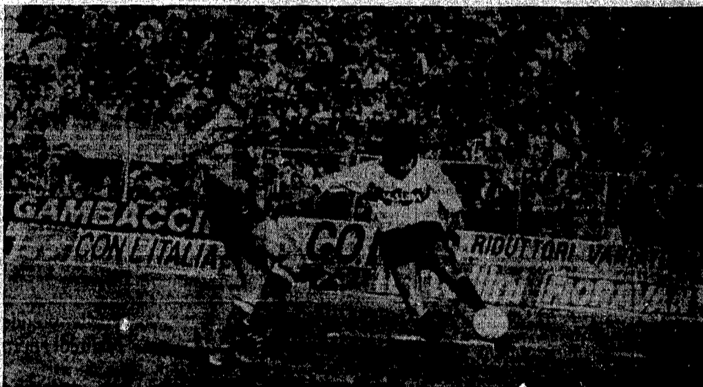
Treccine al vento, stacco perfetto, Gullit (foto accanto al titolo) mette a segno il quarto gol del Milan realizzando una doppietta. Qui sopra, il tiro a volo di Diaz che ha dato il via alla vittoria dell'Inter a Pisa

lenti in Tv, ieri, faceva gentile omaggio a Montezemolo e soci citando le cifre sulla vendita di biglietti per l'avvenimento del prossimo anno. In realtà anche se l'attesa è spasmodica (o, forse, si vuole far apparire a tutti i costi tale: è un po' come Sanremo, O no?), il Mondiale italiano è già un mezzo fallimento, un'occasione sprecata per cambiare rotta nella gestione delle nostre città per renderle forse più vivibili, metterle all'avanguardia di quel complesso intreccio che uno stadio costruisce attorno a sé. Certo non è così dappertutto. Dove si sta lavorando seriamente, i risultati si vedono e si vedranno. Ma, purtroppo, su dodici città solo un paio si salvano dal marasma e dall'inefficienza generale. E anche la pioggia di gol, alla fine, finisce soltanto per essere un ricordo di un pomeriggio domenicale.