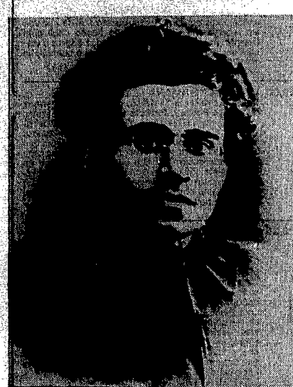
Gramsci: continua la polemica sulle lettere di Grieco

Un sarcofago di canne, nel quale erano stati sepolti un uomo e una donna, è l'importante scoperta fatta tra i ruderi di Huaca Rajada, in Perù. La tomba reale, con caratteristiche analoghe a quelle del Signore di Sipan (l'altro importante ritrovamento, paragonato per importanza a quello del faraone egizio Tutankamon), appartiene alla civiltà pre-incasica. Anche stabilirsi nel Nord del Perù verso la fine del secondo secolo avanti Cristo, e che culminò nella regione fino all'undicesimo secolo dopo Cristo, quando crollò sotto la conquista degli Incas.