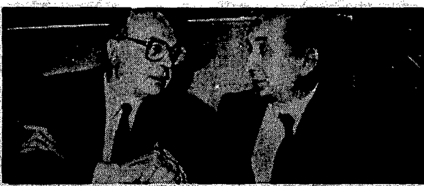
Bettino Craxi, a sinistra, e Ciriaco De Mita